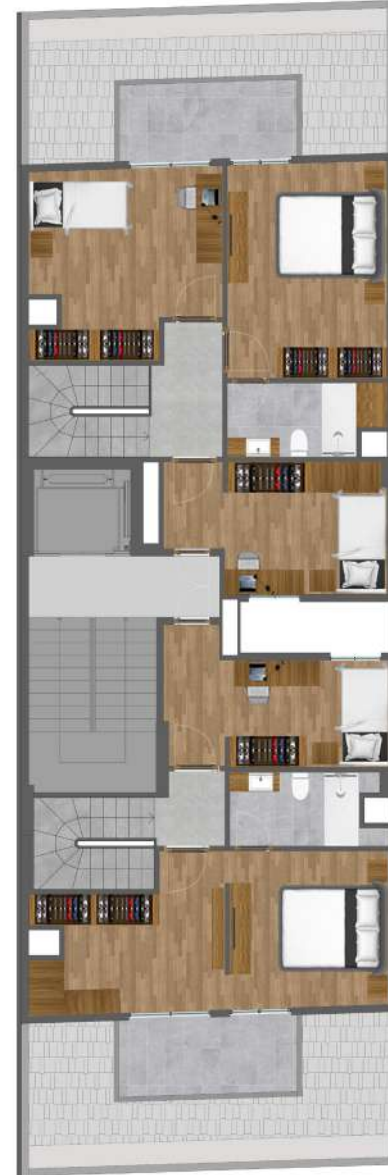
DUBLEX ÜST KAT