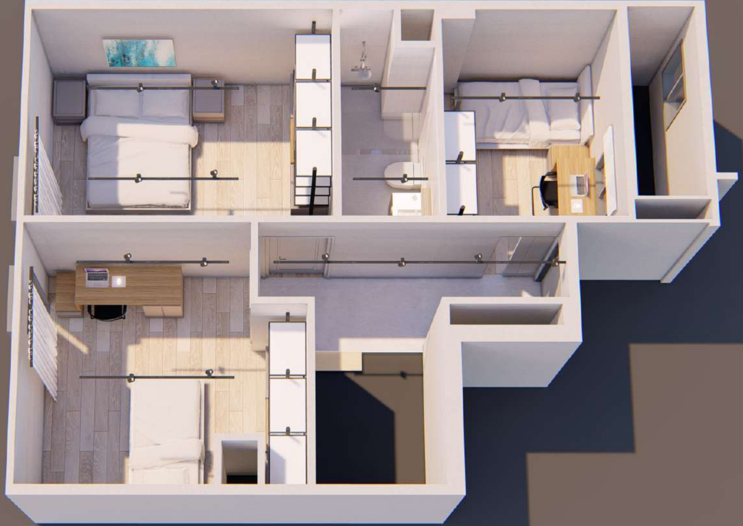
DUBLEX ÜST KAT