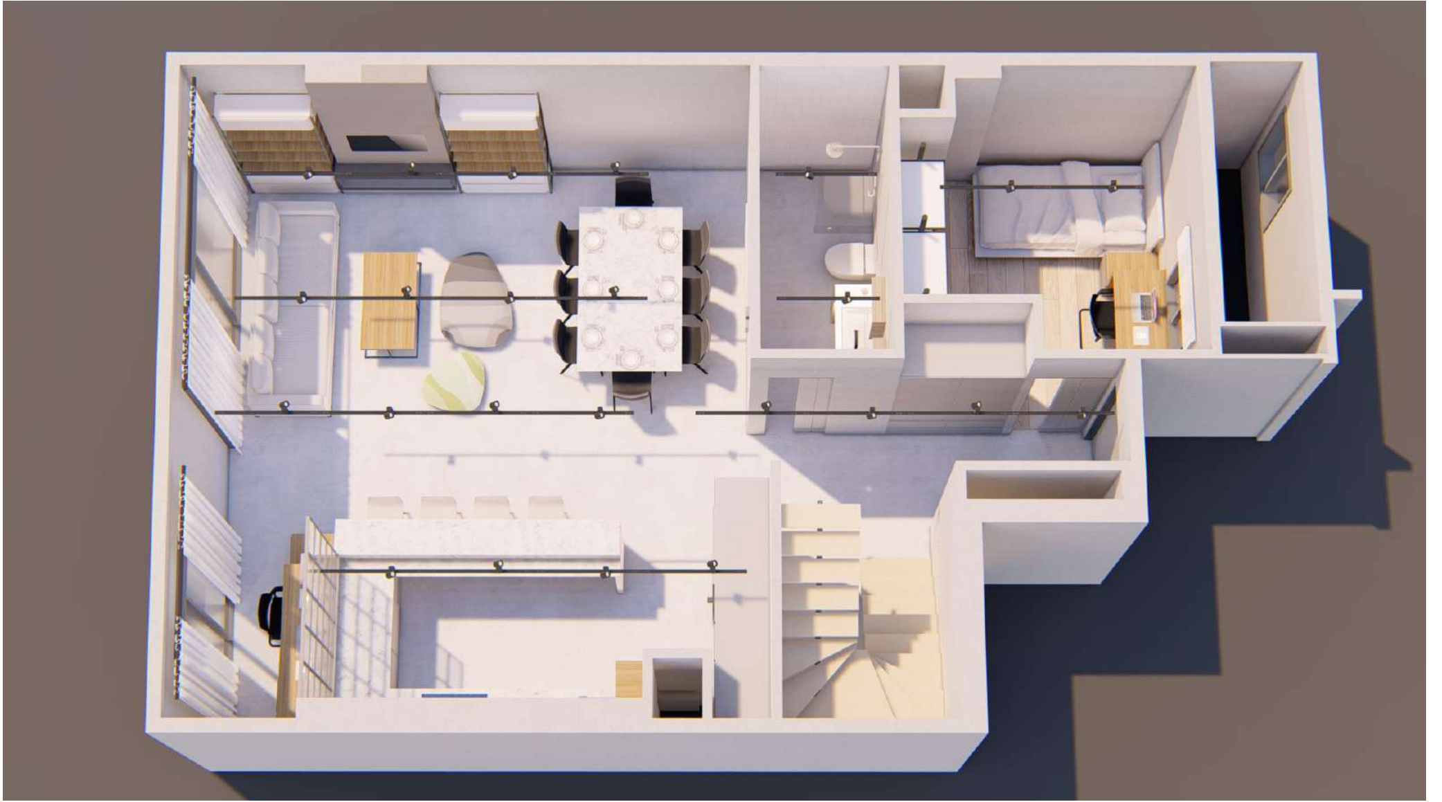
DUBLEX ALT KAT