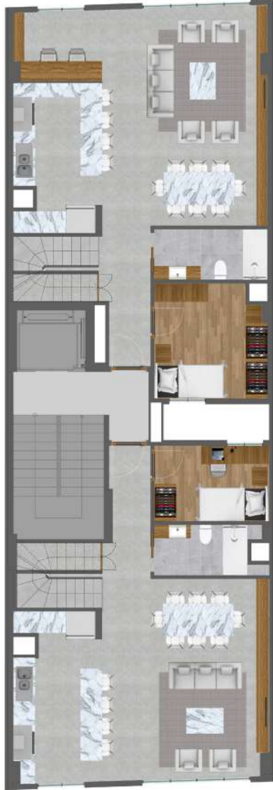
DUBLEX ALT KAT